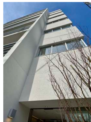
エントランス見上げ