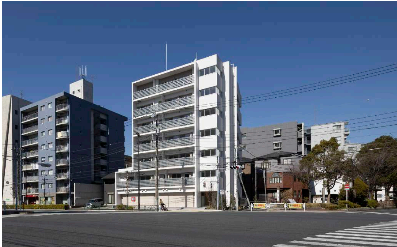
交差点からの全景