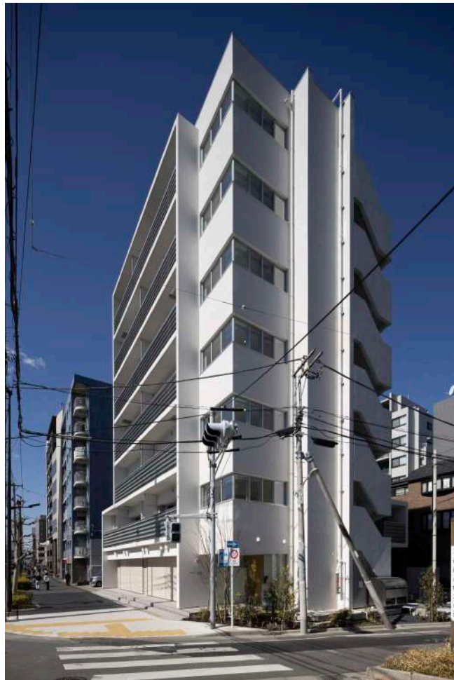
コーナーにL型に配置されたりビングの窓