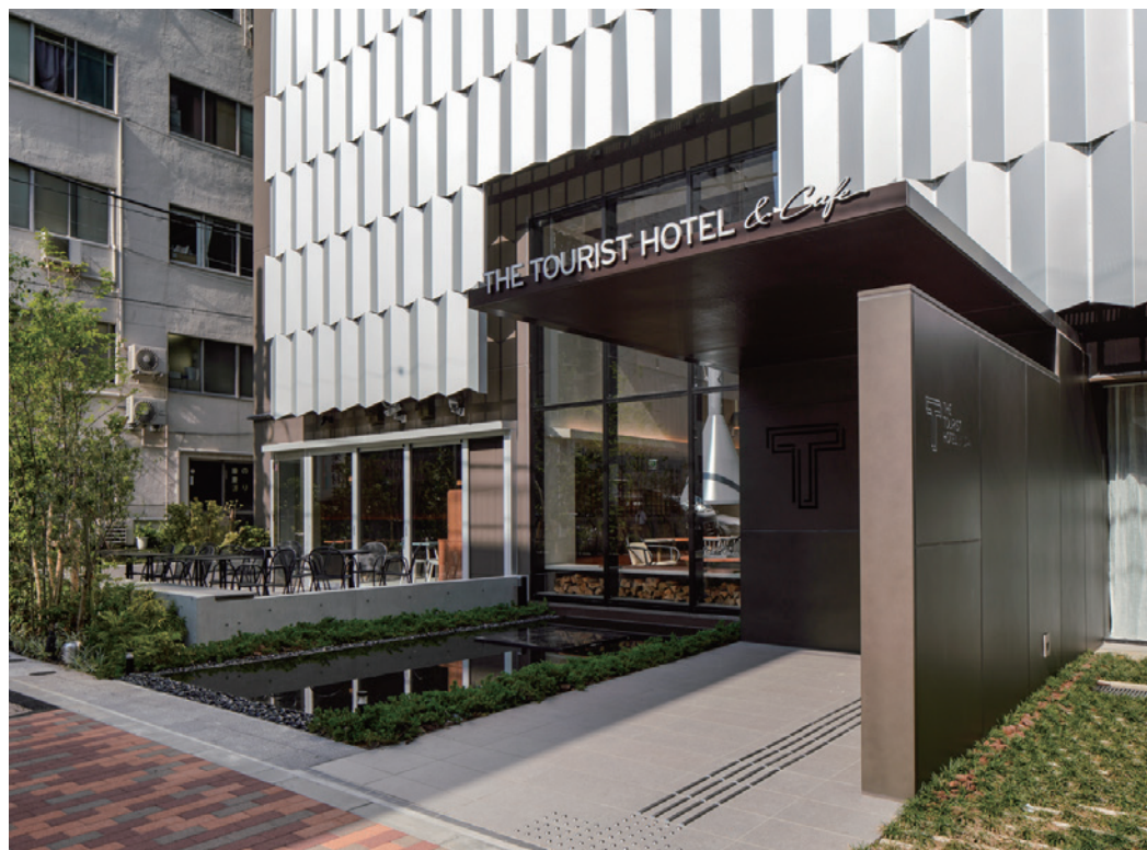
向所在地区所敞开的酒店入口周边