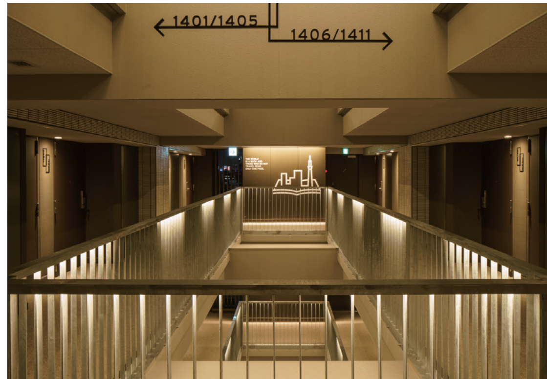
中庭正面，可以观察到不同楼层有着不同的图像表达的旅途相关词句