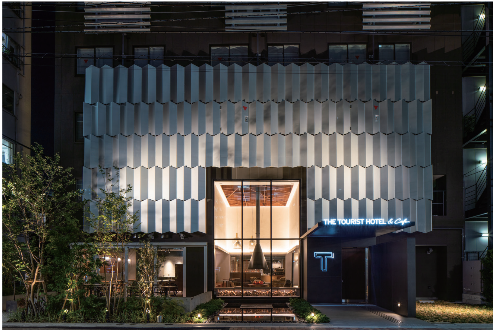
漂浮在表皮上的矢絰样式纹样正立面夜景