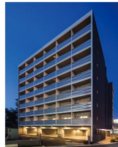
车站侧的立面夜景