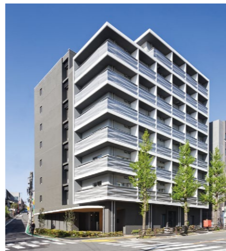
面向十字路口的立面