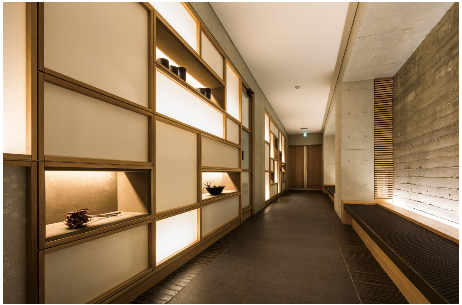
由行灯墙与榻榻米一起构成的“走廊”