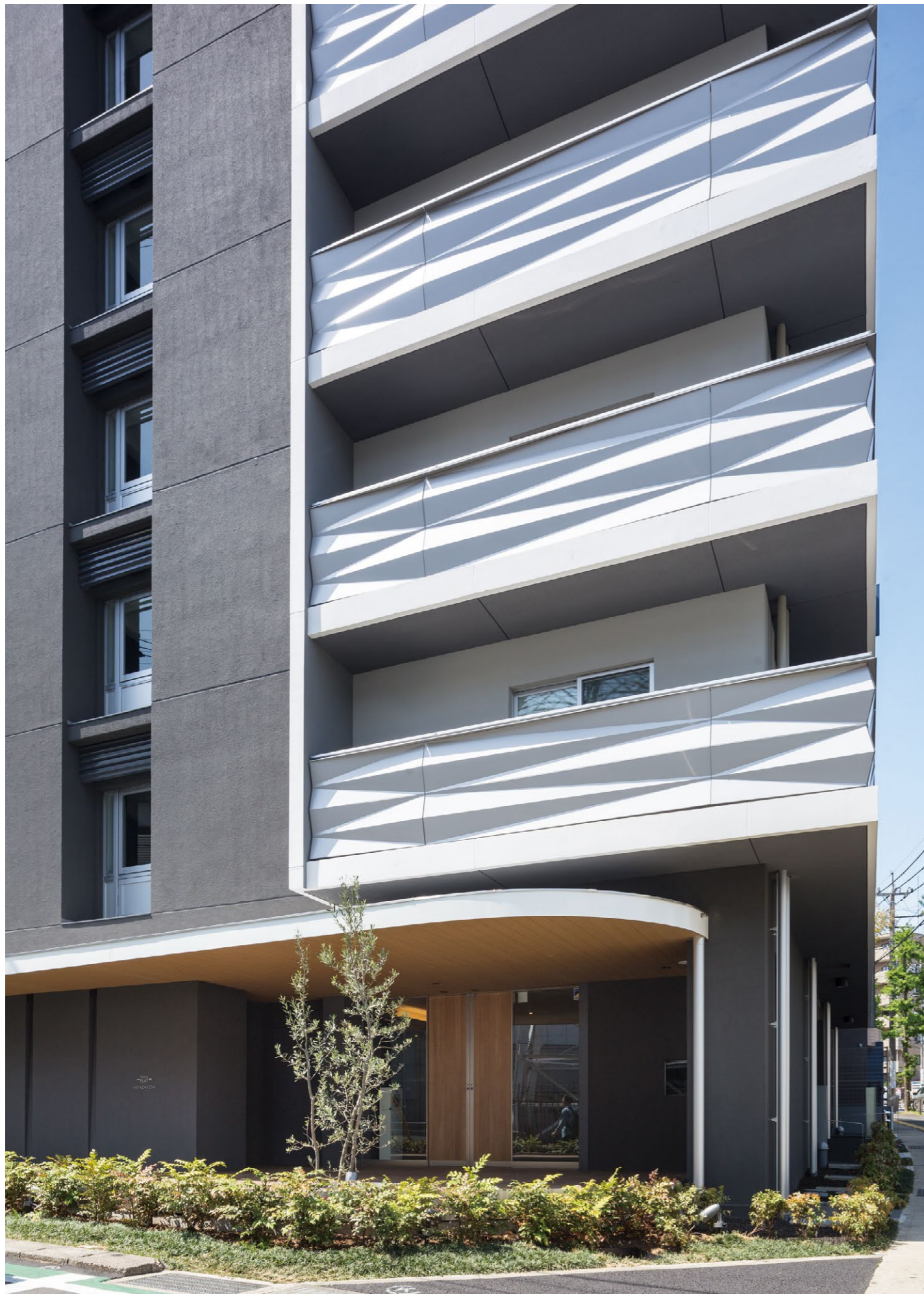
面向十字路口的开放式平台和出入口 铝制扶手受到阳光的照射，呈现出立体的“菱文样”图案