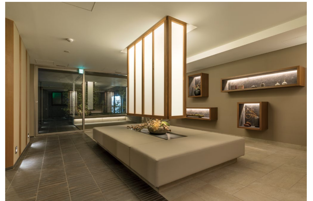
吊灯和沙发同时配置的休息室