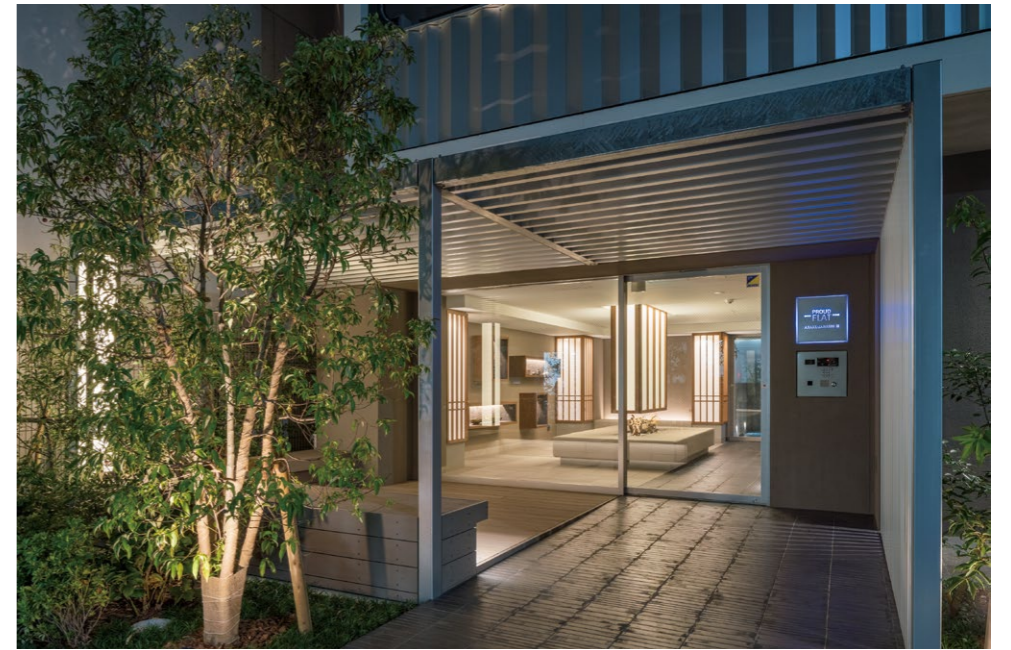
平台和休息室的行灯给街道带来了安心感