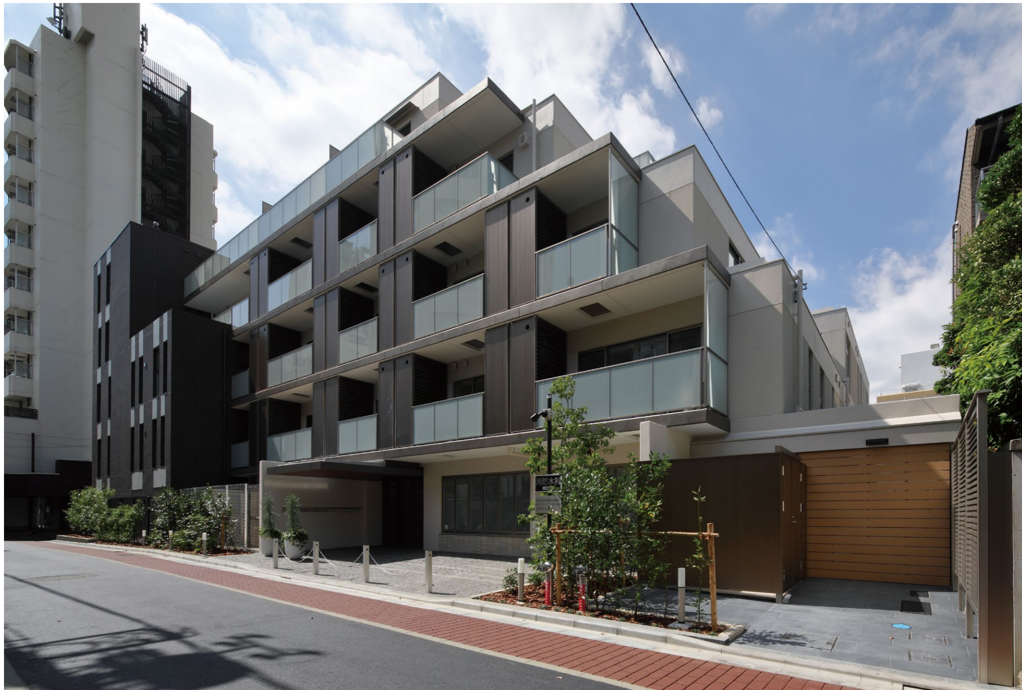
设置了出入口的东侧立面