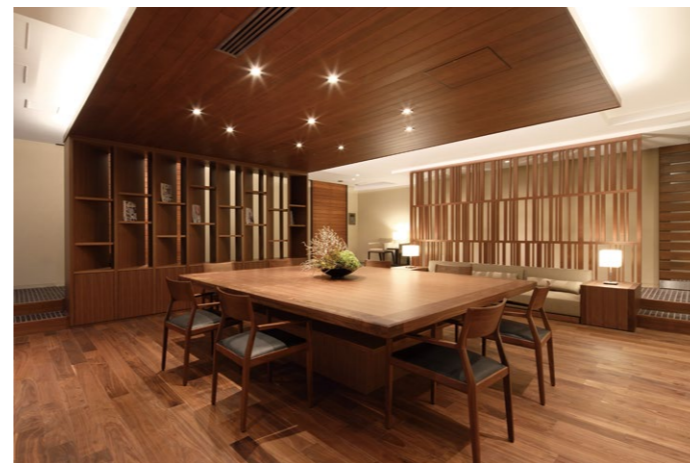
休息室也可以作为共享空间使用